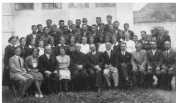
Mała matura, rok szk. 1938/1939

13 września 1939 r. – Do Leżajska wkroczyły oddziały niemieckiej 28. zmotoryzowanej dywizji piechoty i 8. zmechanizowanej dywizji piechoty.