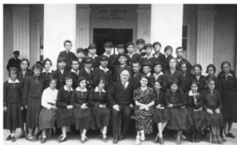
Mała matura, rok szk. 1937/1938