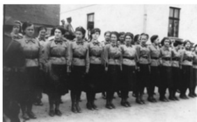
Zbiórka PWK, 1938 r.