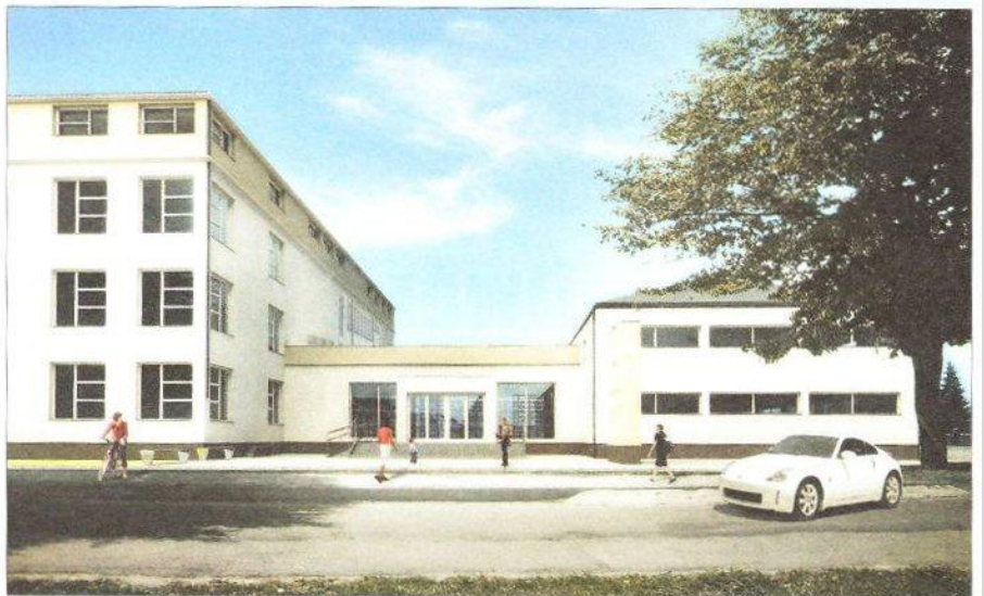
Wizualizacje projektu rozbudowy Zespołu Szkół Licealnych w Leżajsku