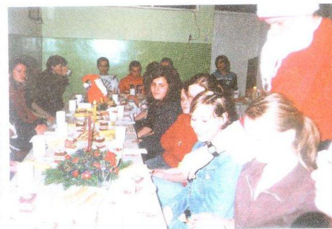
Studenci NKJO, młodzież z Zespołu Szkół Licealnych, młodzież z Zespołu Szkół Technicznych