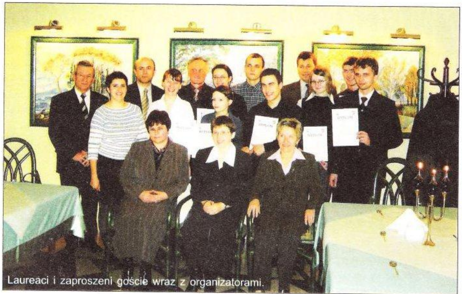
Laureaci i zaproszeni goście wraz z organizatorami.