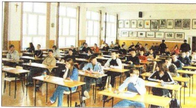
W auli ZSL młodzież zmagano się z zadaniami matematycznymi.

ce, Grodzisko Górne oraz wszystkie 3 powiatowe ponadgimnazjalne szkoły: Zespół Szkół Licealnych w Leżajsku, Zespół Szkół Technicz-