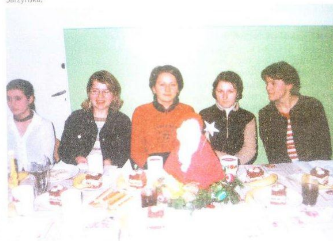
Zwycięzynie konkursu na najładniejszy i najciekawszy stroik świąteczny.