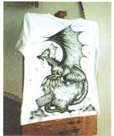
Smok - to mój ulubiony motyw do malowania.

- Wyróżnienie poprzez udział w wystawie pracy na IV Ogólnopolskim Konkursie Plastycznym pt. "ILUSTRACJE DO WIERSZY JÓZEFA ADAMA MICKIEWICZA"