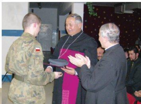
Wręczenie czapki "Maciejówki" J.E. ks. bp. E. Białogłowskiemu

występ artystyczny z wykonaniem najpiękniejszych kolęd polskich przygotowanych przez młodzież ZSO Nr 1 w Rzeszowie; wręczenie czapki strzeleckiej maciejówki; ks. Bp Edwardowi Białogłowskiemu przez młodzież strzelecką; wręczenie okolicznościowych podziękowań; modlitwa, składanie życzeń, łamanie się opłatkiem; spożycie potraw wigilijnych.