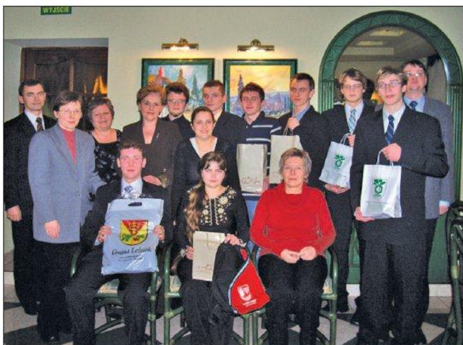
Laureaci konkursu z organizatorami oraz sponsorami nagród