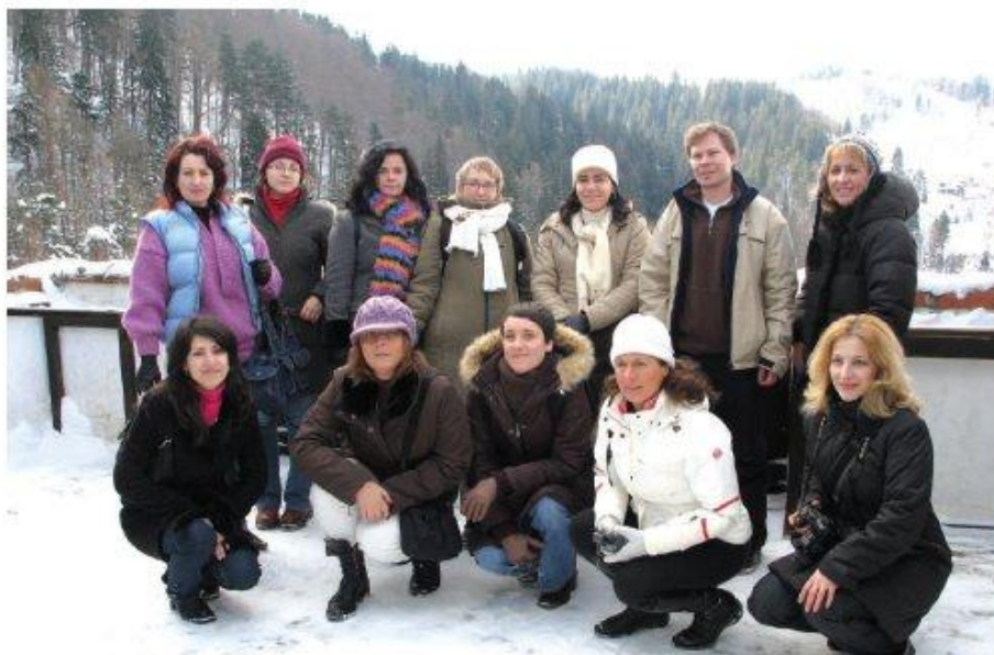
Nauczyciele z Polski, Portugalii, Włoch i Rumunii na spotkaniu roboczym w Galati (Rumunia) – styczeń 2008