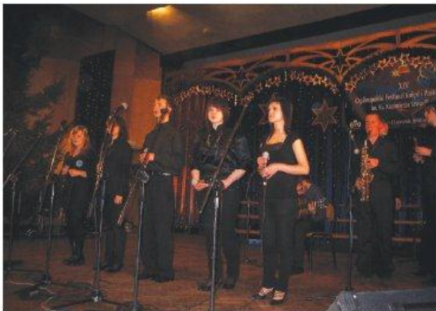
Zespół „Labirynt” podczas koncertu galowego

Województwo podkarpackie, w kategorii zespołów reprezentował właśnie „Labirynt”, który uzyskał nominację do finału po przesłuchaniach wojewódzkich w Rzeszowie, jako jedyny w tej grupie.