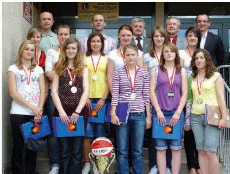
Koszykarki wraz z trenerem i opiekunem oraz przedstawiciele Powiatu i Dyrektor ZSL w Leżajsku.

Więcej informacji o sukcesach koszykarek znajdą Państwo na str. 21-24.