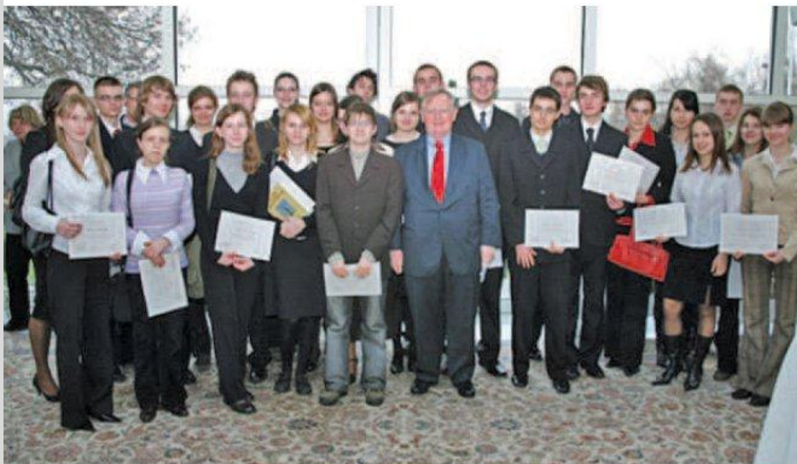
Laureaci w rezydencji z Ambasadorem

Kolejnym interesującym punktem programu była wizyta w Ambasadzie Stanów Zjednoczonych Ameryki. Laureaci mieli okazję wysłuchania wykładów wyłącznie w języku angielskim i poszerzenia swojej wiedzy z historii i kinematografii amerykańskiej dzięki prezentacjom przygotowanym przez dy-