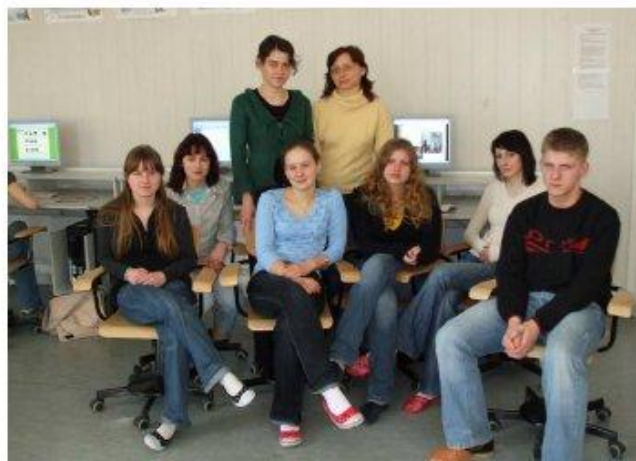
Finaliści konkursu wraz z koordynatorami