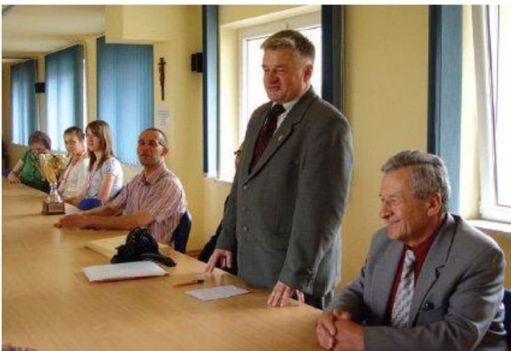
Gratulacje dla koszykarek