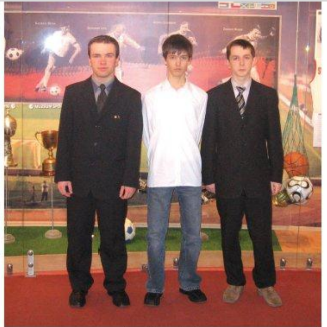
Drużyna z Zespołu Szkół Licealnych

Sukces leżajskich licealistów jest ogromnym osiągnięciem, jeśli zważymy na to, że w turnieju wzięło udział 25 tysięcy osób z całej Polski. Patronat nad konkursem sprawował PKOl, co podniosło prestiż tego przedsięwzięcia. Uczniowie ZSL otrzymali okazałe puchary, dyplomy, wartościowy sprzęt RTV, książki oraz inne, drogie