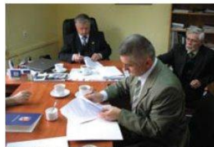
Zarząd Powiatu podpisuje umowę z wykonawcą