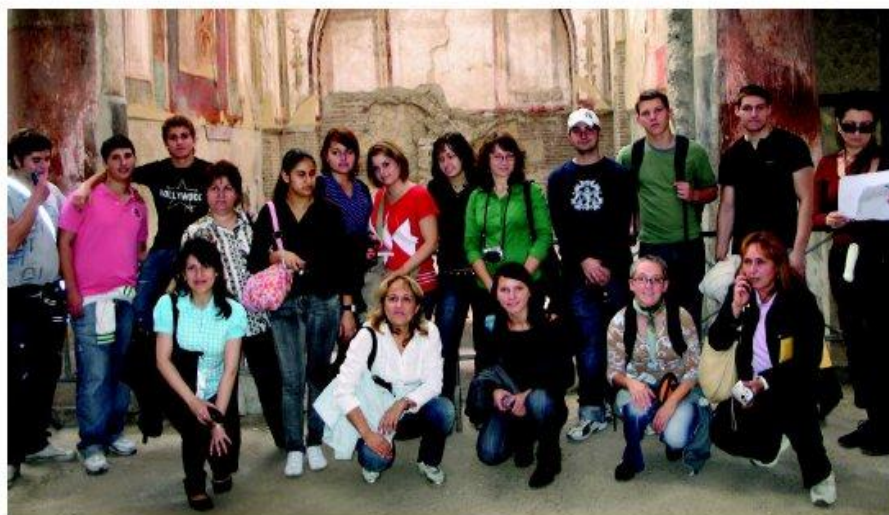
Uczniowie i nauczyciele z Włoch, Rumunii i Polski podczas zwiedzania ruin miasta Ercolano...

Następny dzień zaczął się od zwiedzania ruin starożytnego miasta Ercolano, a także zapoznawania się z grupą. Rozmawialiśmy o ulubionych rozrywkach tamtejszej młodzieży, o naszych zainteresowaniach, cechach charakterystycznych obojga narodów, a także sprawach bardziej związanych z tematami projektu takimi jak: najczęściej wybierane przez młodzież zawody, oferty na rynku pracy oraz trudności związane z podejmowaniem pracy przez młodzież. Przedstawiliśmy im także, jak sytuacja wygląda w naszym kraju i jakie polska młodzież ma możliwości kształcić się do wybranego zawodu.