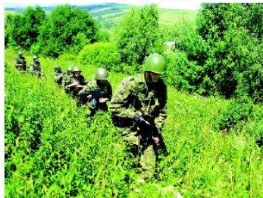
Marsz kondycyjny w Trzciancu