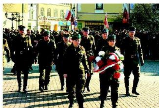
Rocznica Śmierci Leopolda Lisa Kuli