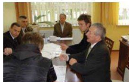
Przekazanie terenu i dokumentacji budowy