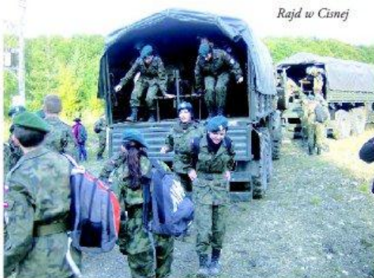
Rajd w Cisnej