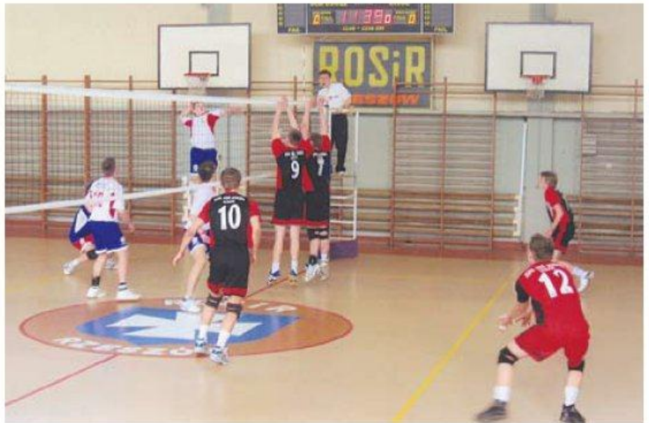
Rozgrywki i wręczenie nagród