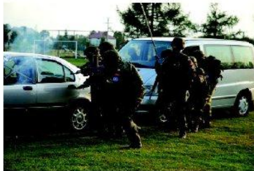
Pobyt w siedzibie strzeleckiej podczas Dożynek w Kurylówce