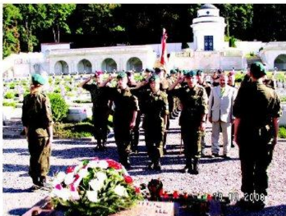
Strzelcy na Cmentarzu Orlim Łowickim