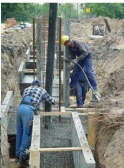
Stan robót na 5 czerwca br.