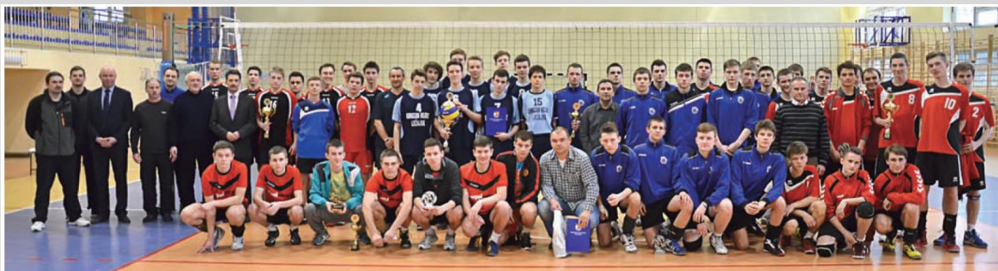
▲ Turniej siatkarski – wspólna fotografia.