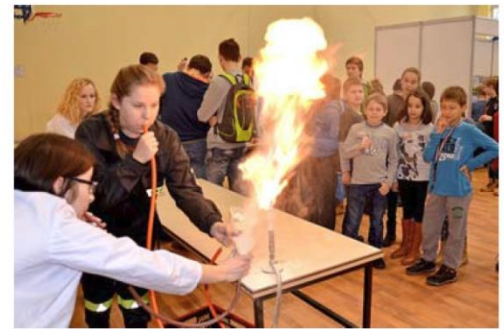
▲ Stoiska klas biologiczno-chemicznych Zespołu Szkół Licealnych w Leżajsku