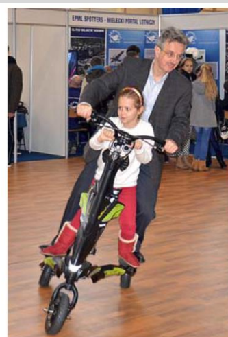
▲ Przejazdka trójkołowym pojazdem elektrycznym