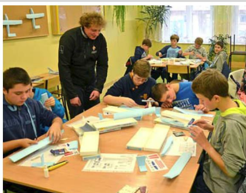
▲ Warsztaty modelarskie z budowy szybowców prowadzone przez Aeroklub Mielecki im. Braci Działowskich