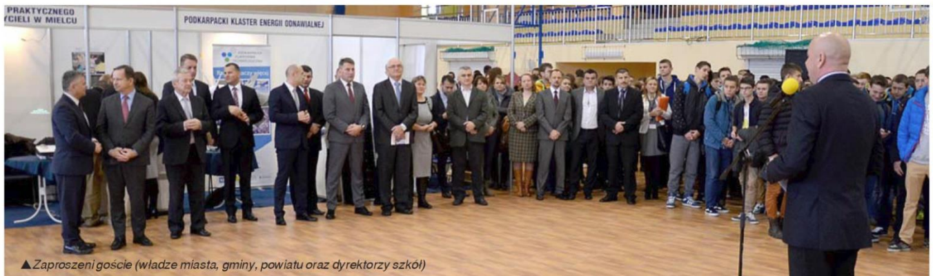
▲ Zaproszeni goście (władze miasta, gminy, powiatu oraz dyrektorzy szkół)