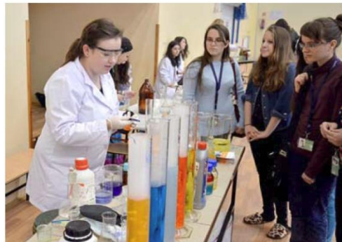
▲ Doświadczenia chemiczne prowadzone przez studentów Wydziału Chemii Politechniki Rzeszowskiej