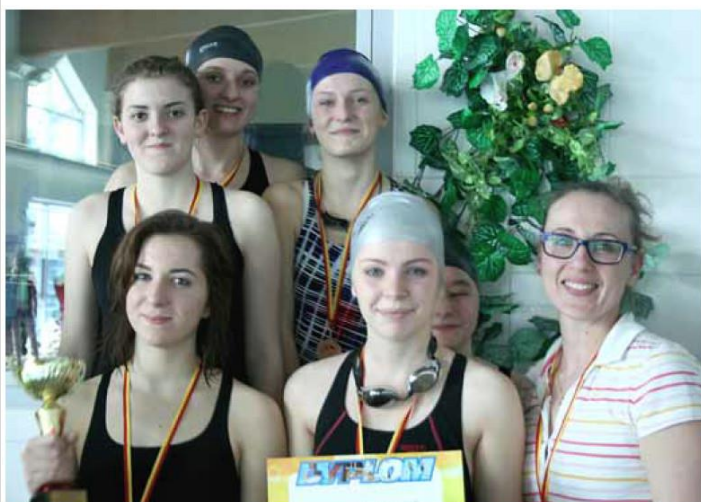
▲ Sztafeta dziewczyn – „brązowych” medalistek.

Katarzyna Rynkiewicz, Stanisław Kosakowski