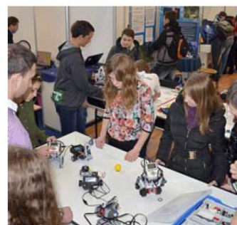
▲ Roboty z Zespołu Szkół im. prof. Franciszka Lejw w Grodzisku Górnym