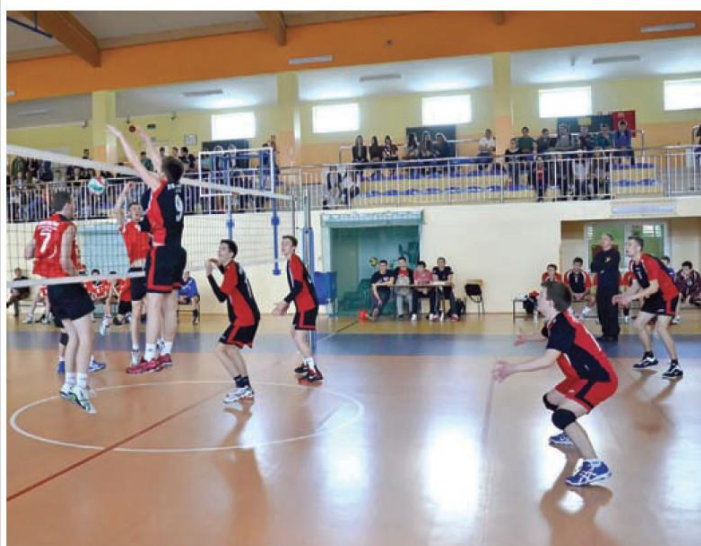
▲ Rozgrywki siatkarskie.