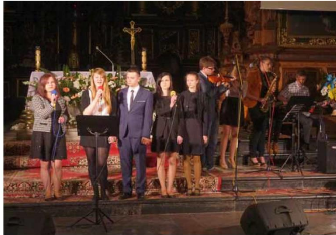
▲ Zespół wokально-instrumentalny Labirynt z Zespołu Szkół Licealnych w Leżajsku.

Repertuar Przeegładu jest z roku na rok coraz bogatszy, zaskakuje nas różnorodnością form, ciekawymi aranżacjami oraz profesjo-