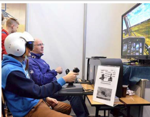
▲ Lot symulatorem śmigłowca Black Hawk – Mielecki Portal Lotniczy EPML Spotters