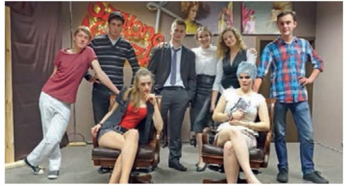
Teatr Kurtyna Szalone Nożyczki