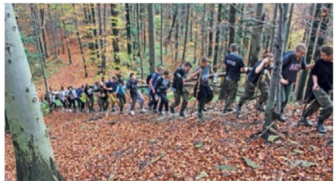
Młodzież podczas obozu wędrownego w Bieszczadach

zentowane było dla mieszkańców całego miasta,