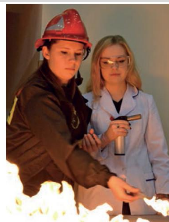
Pokazy podczas Festiwalu Nauki i Techniki

■ Olimpiadzie „O Diamentowy Indeks AGH” w zakresie czterech