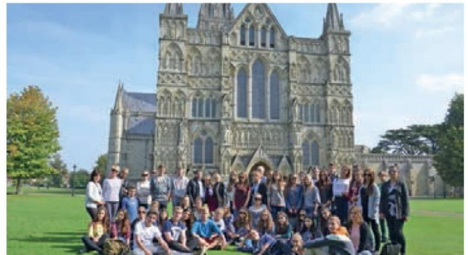
Warsztaty językowe młodzieży w Anglii

▪ uczniowie biorą udział w licznych wyjazdach: warsztaty językowe – w roku 2014 licealiści dosko-