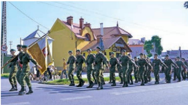
Pielgrzymka Służb Mundurowych - Jednostka Strzelecka ZSL

▪ działalność wolontariatu: współpraca z Caritas, organizacja XI Powiatowego Przeglądu Twórczości Artystycznej Osób Niepełnosprawnych, przeprowadzanie zabawy andrzejkowej dla podopiecznych Warsztatów Terapii Zajęciowej, udział w akcji pod hasłem „Zostań pomocnikiem św. Mikołaja”, akcja charytatywna „Świąteczna Paczka dla Hospicjum”,