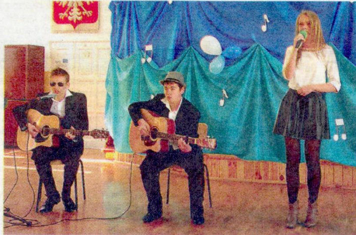
Na scenie zaprezentowali się nie tylko soliści, ale też duety i zespoły

Jury przy ocenianiu uczestników brało pod uwagę następują-