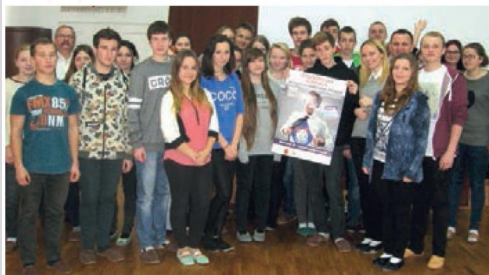
Ogólnopolska Olimpiada o Państwie i Prawie

Uczniowie naszego liceum brali udział w konkursach przedmiotowych i osiągnęli wiele sukcesów, między innymi w: