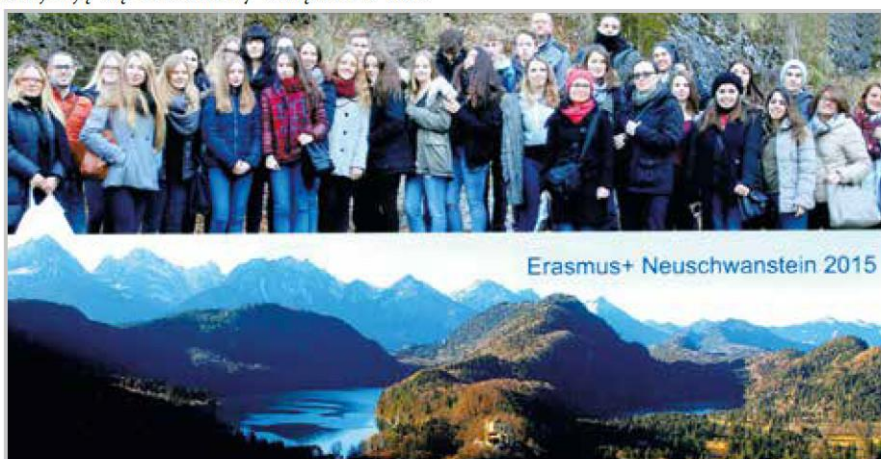
Projekt Erasmus Niemcy

Zakupiono: sprzęt sportowy, książki, sprzęt multimedialny, plansze logistyczne. Dopusażono biura, pracownie lekcyjne, Muzeum Szkolne, internat. Przeznaczono na ten cel 71 681 zł.