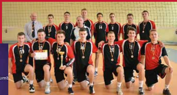
Wicemistrzowie Województwa Podkarpackiego w piłce siatkowej 2016r.