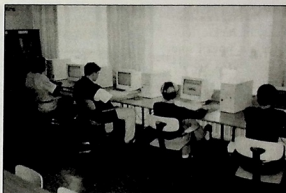
Centrum medialne w bibliotece szkolnej.

„Non scholae, sed vitae discimus” - wier- ni tej maksymie uczniowie szkoły w ostatnich latach licznie „obsadzają” olimpiady filozoficzne i docierają do elimina- cji krajowych. Prowa- dzi ich mgr Ryszard Górnisiewicz - opie- kun Muzeum Szkolne- go. W minionym dzie- sięcioleciu było ono kilkakrotnie nagradzane tytułem najlepszego muzeum szkolnego w wojewódz- twie.