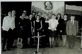
„Katyń - Golgota Wschodu” - program szkolny (8.09.2000 r.).

Zwłaszcza konkursy literackie, recytatorskie, poczci śpiewanej cieszą się nie słabnącym powodzeniem u młodzieży. Sporo jest laureatów wojewódzkich i regionalnych w tym współzawodnictwie. Znaczny udział w przygotowaniu uczniów do wielu z nich ma wicedyrektor szkoły,