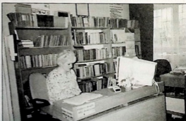
Komputerowa obsługa czytelników w bibliotece szkolnej.