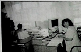
Gabinet administracji szkolnej.

dzień nauczania zawodowego bez możliwości czy umiejętności korzystania z technik informatycznych. Ekonomiczne programy, jak „Płatnik”, „Magazynier”, „Kasjer”, „Rewizor”, „Subiekt”, „Referent” stają się podstawowymi środkami dydaktycznymi, którymi dysponuje szkoła.