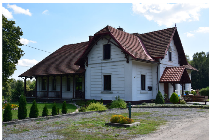
Zabytkowy budynek nadleśnictwa Wydrze