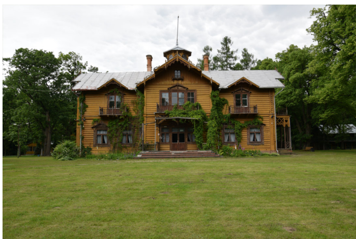
Julin, zabytkowy Pałacyk Myśliwski

Ale na Julinie wycieczka się nie kończy. Kierujemy się teraz w stronę zabytkowego budynku nadleśnictwa Wydrze . Powyżej tych zabudowań, w stronę lasu, znajduje się świetnie przygotowane miejsce spotkań okolicznościowych i gład pamięci koła łowieckiego RYŚ w Łańcucie.