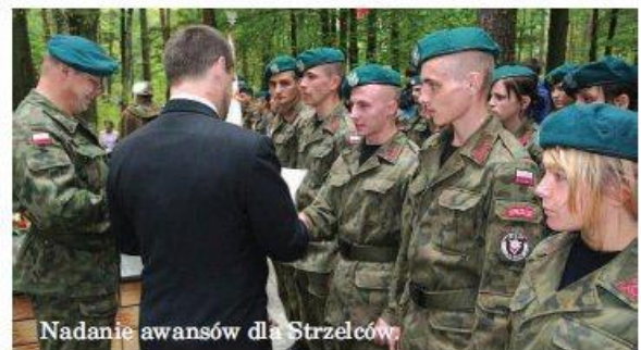
Nadanie awansów dla Strzelców