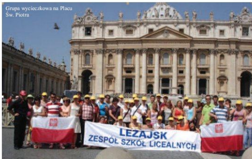
Grupa wycieczkowa na Placu Św. Piotra