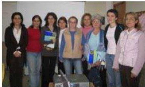
Grupa nauczycieli z Portugalii, Włoch, Rumunii i Polski

do realizacji, podsumowano wyniki dotychczasowych działań oraz sprecyzowano plan pracy na kolejne dwa lata projektu. Nawiązanie współpracy z nauczycielami z innych krajów pozwoli na wymianę doświadczeń oraz przyczyni się do promocji miasta, które już cieszy się dużym zainteresowaniem uczestników programu pochodzących z różnych części Europy.