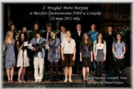
X Przegląd Pieśni Maryjnej w Bazylice Zwiastowania NMP w Leżajsku 22 maja 2011 roku