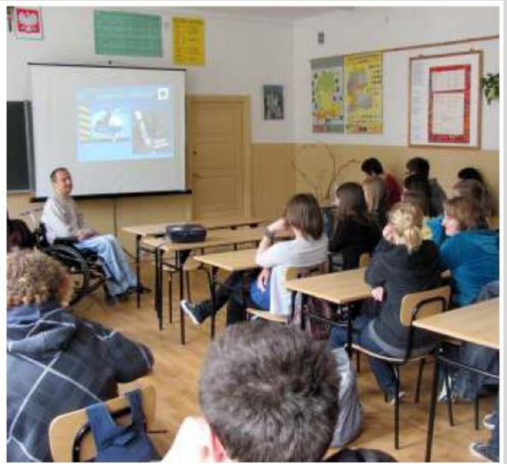
▲ Uczniowie z zaciekawieniem słuchali o zagrożeniach, jakie niesie ze sobą czas wakacji.

na ulicach czy płytką wyobraźnią przy skokach do wody. Spotkania prowadzone były przez osoby, które same uległy wypadkowi, przez co młodzież naocznie mogła przekonać się jak tragiczne w skutkach może być nieodpowiedzialne zachowanie się nad wodą czy w ruchu drogowym. Stowarzyszenie „Dobry Dom”