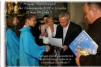
X Przegląd Pieśni Maryjnej w Bazylice Zwiastowania NMP w Leżajsku 22 maja 2011 roku