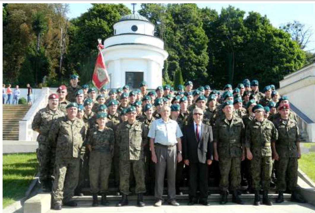
▲ Na Cmentarzu Orłąt.