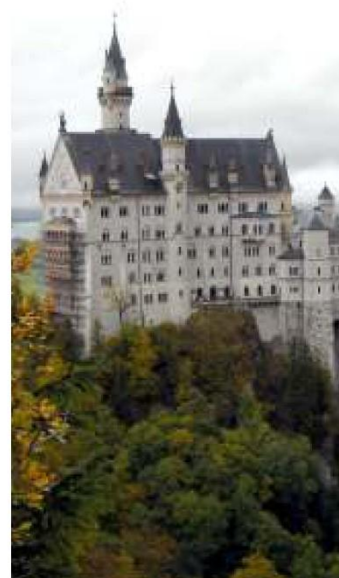
▲ Południe Bawarii – zamek Neuschwanstein