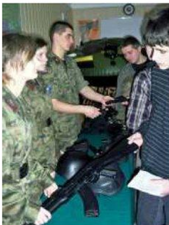
▲ Prezentacja klasy wojskowej cieszyła się ogromnym zainteresowaniem.