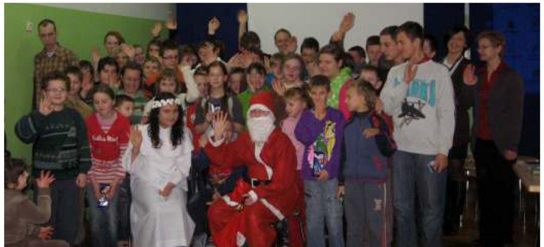
▲ Szkolne Koło Wolontariatu.