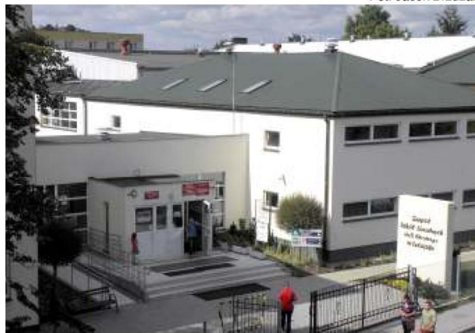
▲ Tak obecnie wygląda budynek ZSL - od wejścia głównego.

Zmieniający się świat daje nowe możliwości. Oprócz tradycyjnej tablicy i kredy coraz częściej wykorzystuje się projektory i tablice interaktywne. Rozszerzyła się też oferta dydaktyczna poza systemem klasowo-lekcyjnym. Metodą aktywizującą jest na