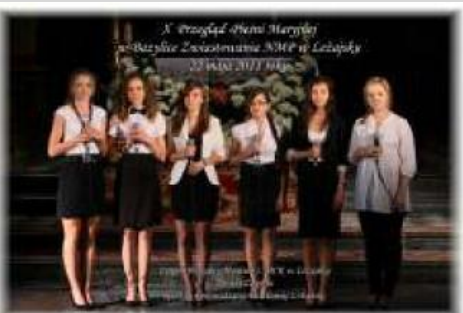
X Przegląd Pieśni Maryjnej w Bazylice Zwiastowania NMP w Leżajsku 22 maja 2011 roku