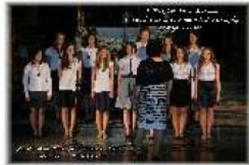
X Przegląd Pieśni Maryjnej w Bazylice Zwiastowania NMP w Leżajsku 22 maja 2011 roku