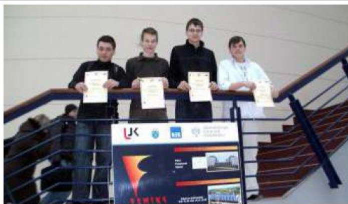
▲ „Młodzi fizycy” z ZSL.

Końcem marca 2011 dla osiemnastu uczniów z klas I rozpoczął się, trwający dwa i pół roku, projekt e-learningowy z fizyki, do którego nasza szkoła zakwalifikowała się spośród stu szkół w Polsce. Grupa uczniów otrzymała bezpłatny dostęp do platformy internetowej, dzięki której systematycznie będzie poszerzać swoją wiedzę z fizyki. Uczniowie w ra-