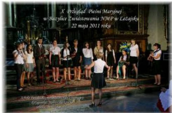
X Przegląd Pieśni Maryjnej w Bazylice Zwiastowania NMP w Leżajsku 22 maja 2011 roku