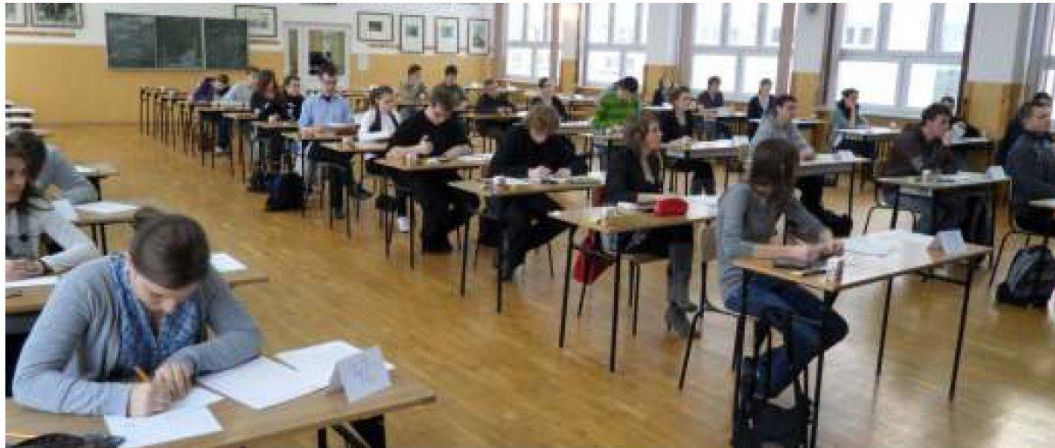
▲ Chętnych do zmierzenia się z matematyką nie brakowało.

Już po raz jedenasty młodzież powiatu leżajskiego uzdolniona matematycznie weryfikowała swą wiedzę biorąc udział w Międzyszkolnym Powiatowym Konkursie Matematycznym „I Ty możesz zostać studentem”, który odbył się 12 lutego 2011 r. w auli ZSL w Leżajsku.