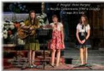
X Przegląd Pieśni Maryjnej w Bazylice Zwiastowania NMP w Leżajsku 22 maja 2011 roku