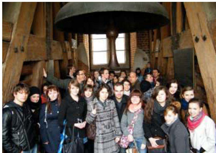
▲ Pobyt grupy z Hiszpanii, Włoch i Niemiec w Leżajsku zaowocował nowymi przyjaźniami.

W międzynarodowych drużynach zmagaliśmy się z nietypowymi zadaniami matematycznymi: z życia codziennego, na logikę, z zagadkami oraz łamigłówkami geometrycznymi. Jednak nasz trud został nagrodzony upominkami. Uczniowie hiszpańscy, niemieccy oraz włoscy rywalizowali także w konkursie wiedzy o Polsce, co przyniosło nam dużo śmiechu, a im pomogło w bliższym poznaniu naszego kraju. Popołudnia mijały naszym gościom na zwiedzaniu Leżajska i poznawaniu jego historii. Zwiedzili Muzeum Ziemi Leżajskiej, Cmentarz Żydowski, rynek i Ratusz Miejski. Zachwyliło ich piękne brzmienie zabytkowych organów w naszym klasztorze, sama Bazylika O.O.