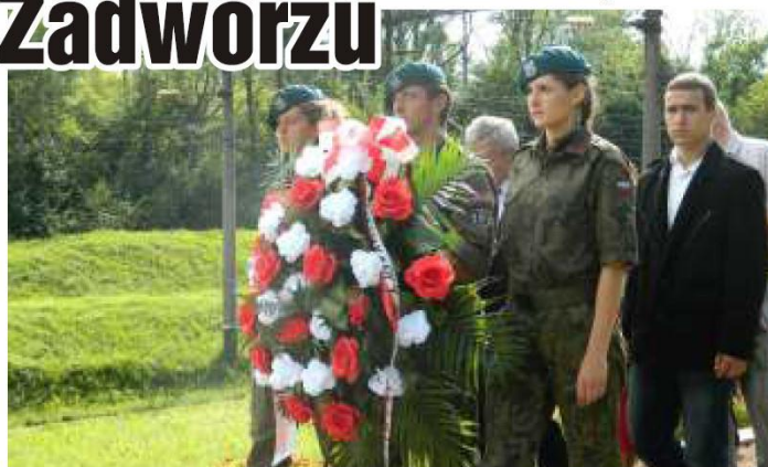
▲ Oddanie hołdu Orłętom Lwowskim.

Stało się już tradycją Zespołu Szkół Licealnych, że jej młodzież w ostatnich dniach wakacji każdego roku wyjeżdża do Zadwórzca. Gdy większość młodzieży w różny sposób odpoczywa jeszcze, wykorzystuje ostatnie dni wakacji, część naszej młodzieży szkolnej poświęcając wolny czas, spędza go poznając „namacalnie” historię odratującej się po zaborach ojczyzny.