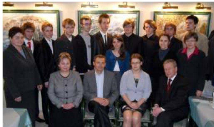
▲ Laureaci, organizatorzy oraz sponsorzy nagród.

CAPRI u państwa Niemczyków, którzy od lat przyjmują w swoich podwojach młodych matematyków. Laureaci otrzymali cenne nagrody ufundowane przez patronów i zarazem sponsorów konkursu w osobach: Starosty Leżajskiego, Wójta Gminy Leżajsk, Burmistrza Miasta i Gminy Nowa Sarzyna oraz Dyrektora ZSL w Leżajsku. Organizatorzy bardzo dziękują