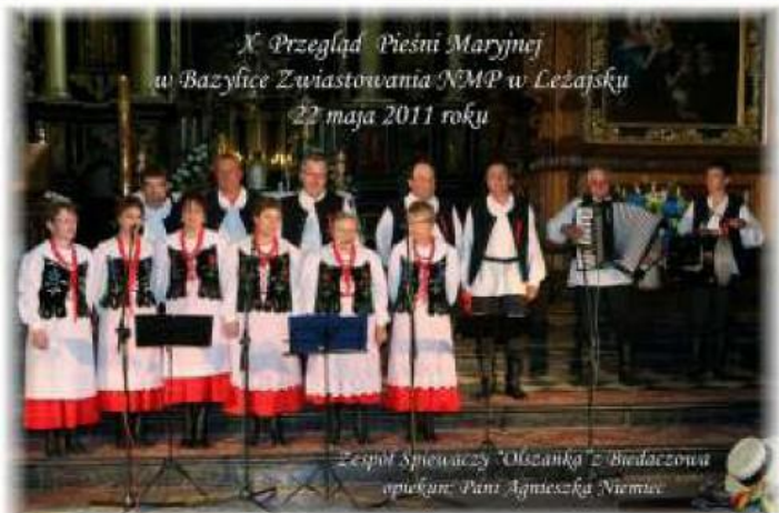
X Przegląd Pieśni Maryjnej w Bazylice Zwiastowania NMP w Leżajsku 22 maja 2011 roku