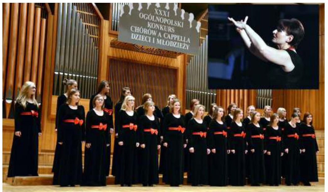
▲ Chór Belcanto.