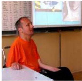
▲ Celem spotkania było uświadomienie młodym ludziom, jakie skutki niosą za sobą ryzykowne skoki do wody oraz nieodpowiedzialne zachowanie się na ulicach.

Poprzez naszą akcję pragniemy dotrzeć do młodych, pełnych optymizmu oraz chęci do życia ludzi i przestrzec ich przed młodzieńczą brawurą, ryzykanctwem