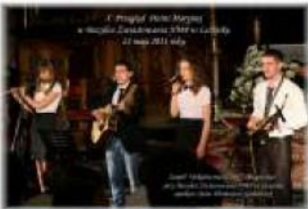
X Przegląd Pieśni Maryjnej w Bazylice Zwiastowania NMP w Leżajsku 22 maja 2011 roku