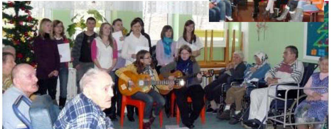
▲ Wolontariusze w Zakładzie Opiekuńczo-Lecznicznym.

Innymi działaniami Szkolnego Koła Wolontariatu w bieżącym roku szkolnym są: