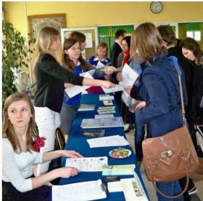
▲ Licealiści wystąpili w roli „gospodarzy - przewodników”.

Zaproszona młodzież miała możliwość zapoznać się z szeroką działalnością pozalekcyjną licealistów, przybierającą formę kół zainteresowań. Przygotowane zostały wystawy dotyczące historii