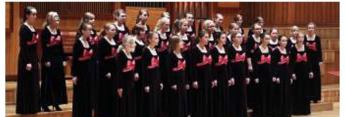
▲ Chór Cantiamo.