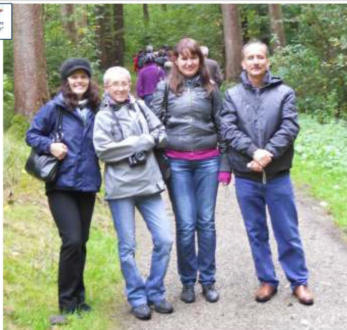
▲ Wędrówka po Oberschonefeld.