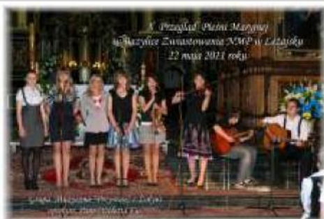
X Przegląd Pieśni Maryjnej w Bazylice Zwiastowania NMP w Leżajsku 22 maja 2011 roku