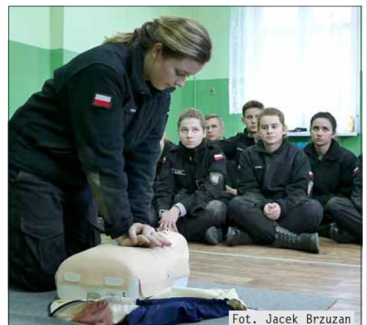
Fot. Jacek Brzuzan