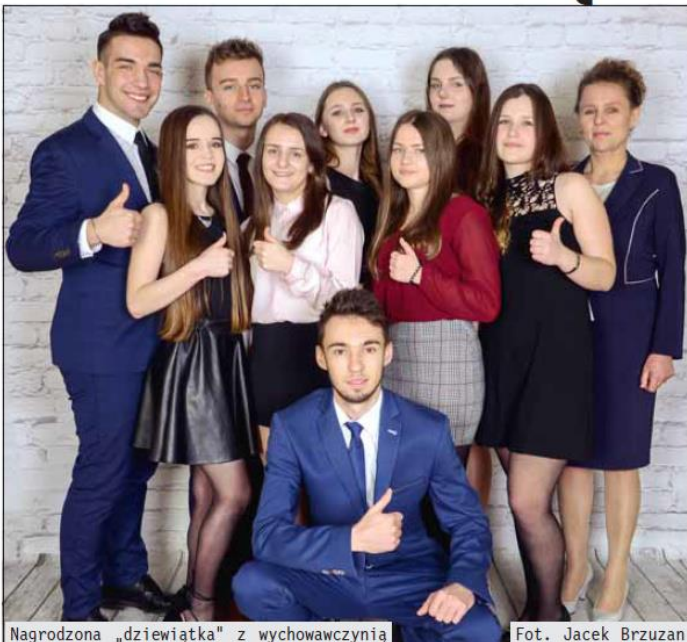
Nagrodzona „dziewiątka” z wychowawczynią